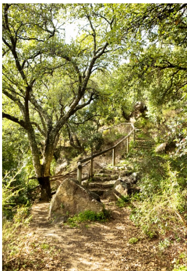
Entrada del mirador "De la grieta"

CÓMO LLEGAR: Desde la Ctra. A-405, entrada principal de Jimena de la Frontera ascender por la Avenida de los Deportes pasando por la Plaza de la Constitución hasta la calle Sevilla, proseguir por Plaza Gibraltar y Plaza del Puerto Morán, tomando finalmente la Calle Llana hasta el final de la misma donde comienza y finaliza el sendero Los Miradores del Risco .