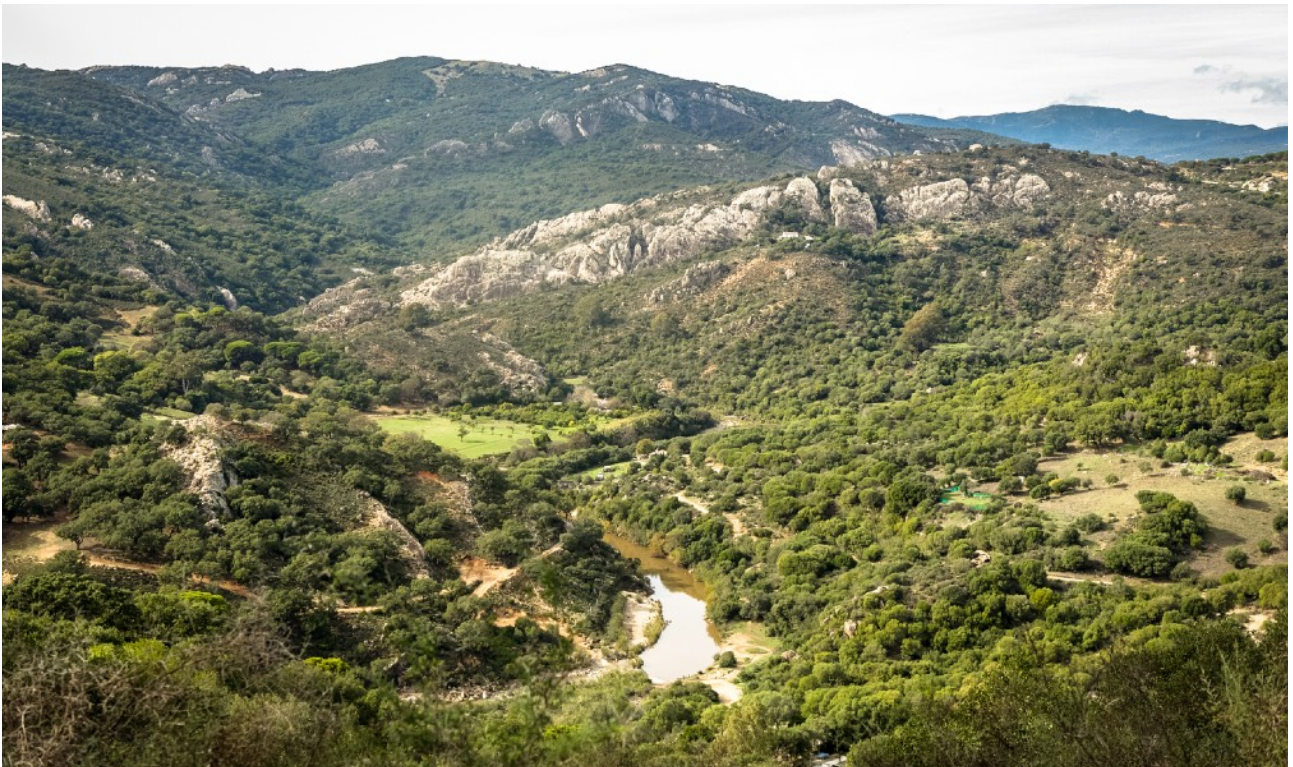
Vista desde el mirador "Del Caracol"